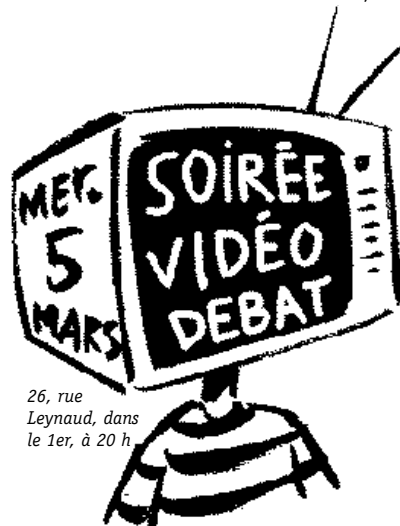
26, rue Leynaud, dans le 1er, à 20 h.